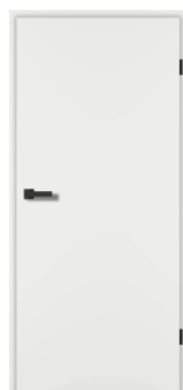
Weiß Matt 9016