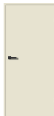
LiveSimple Matt CN08