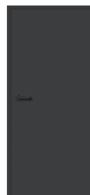
Anthrazitgrau Matt 7016