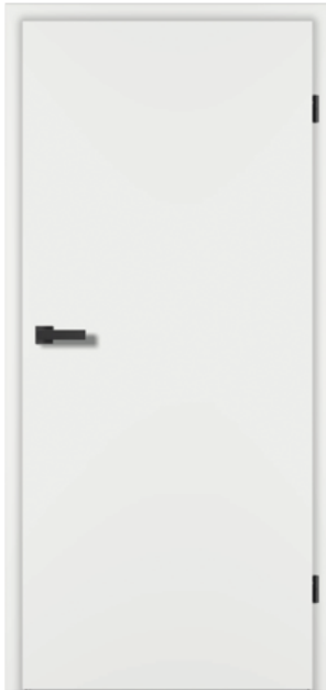
Standard G-TEC® LiveSimple Matt CN08