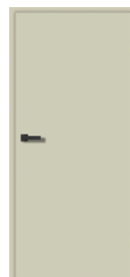
FeelJade Matt CN05