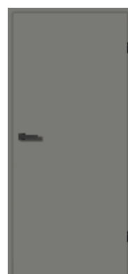
Staubgrau Matt 7037