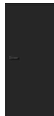
Schwarz Matt 9005